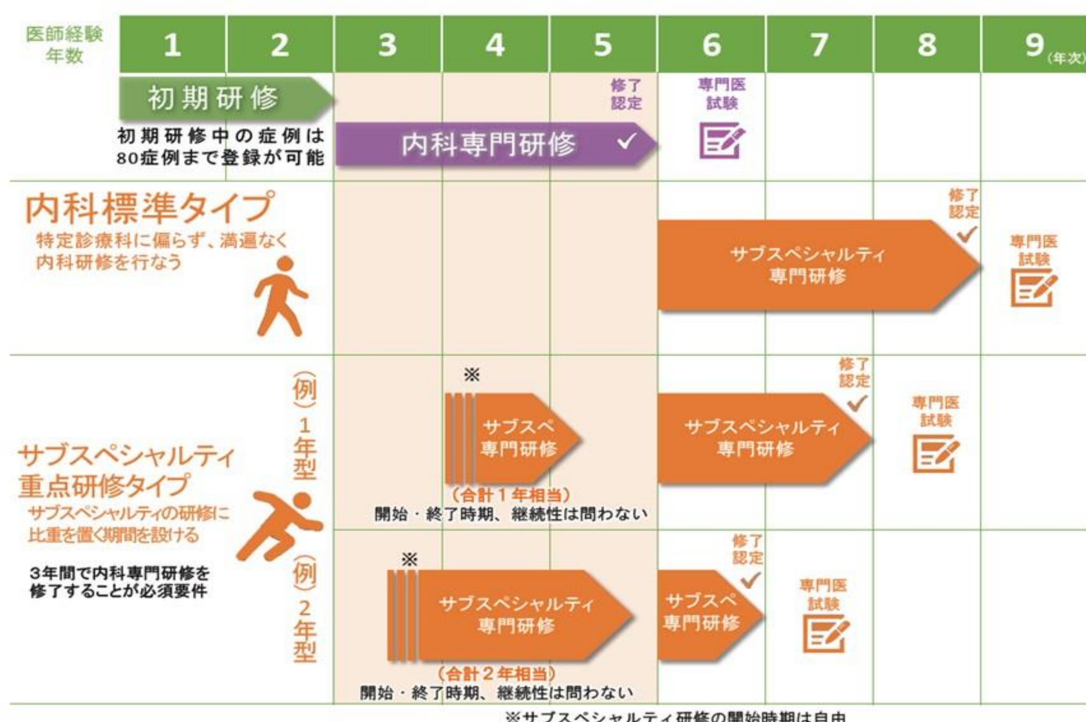
内科専門研修とサブスペ専門研修の連動研修(並行研修)の概念図

新制度が開始される場合も、慶應内科全科ローテートシステムはほとんど影響なく、今まで通りの先輩が経験したシステムのもと、安心して後期研修をおこなうことができます。